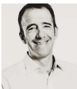
Ulrich Färber LF Consult GmbH